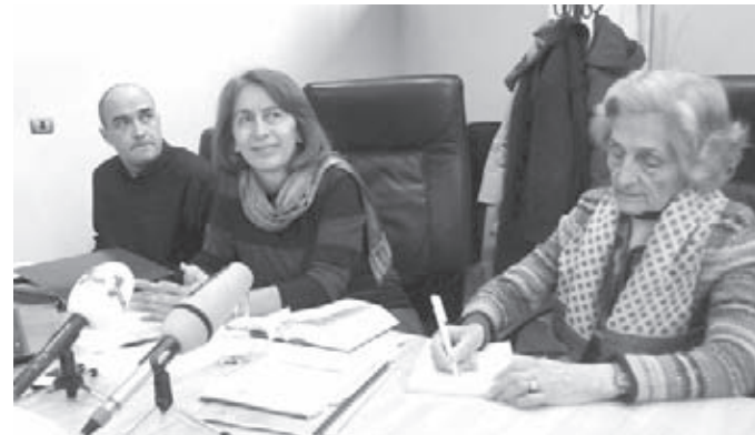
Sa pres konferencije u Podgorici